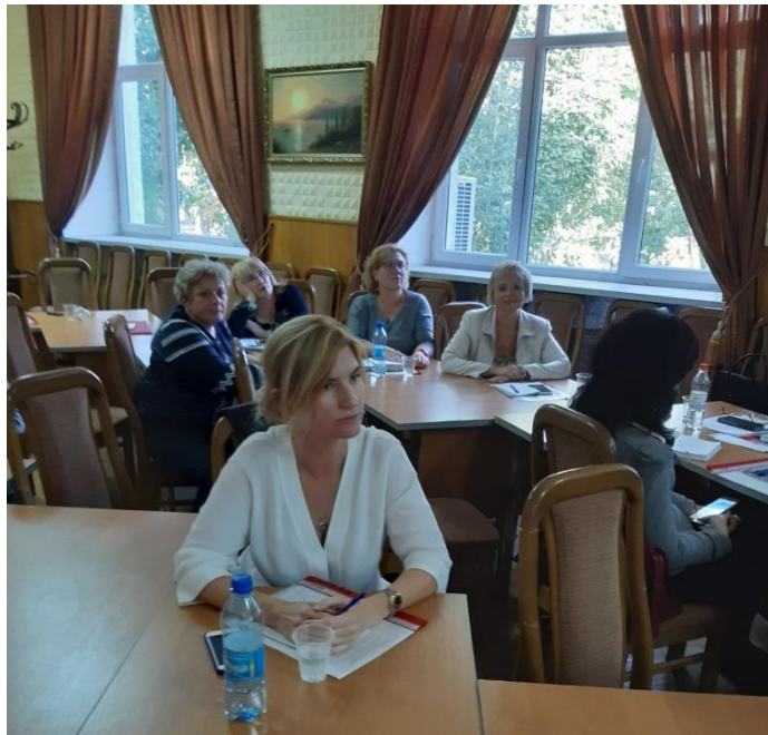
Учасники Круглого столу