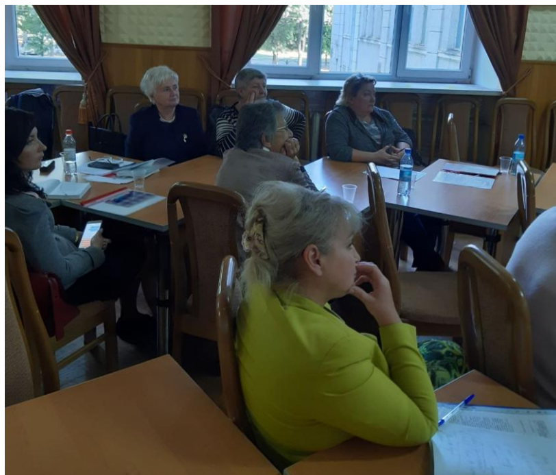
Учасники Круглого столу